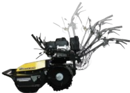
a szállításhoz teljesen lehajtható vezetőkar