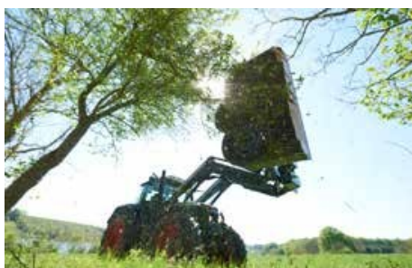
RC 132 késes sövényvágó fej