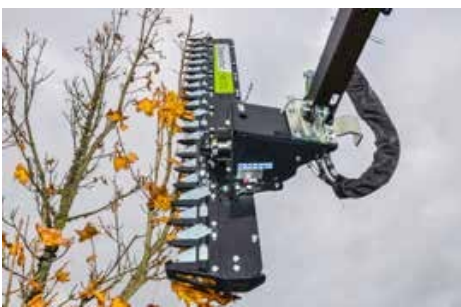
HS 172-242 alternáló ágvágó fej