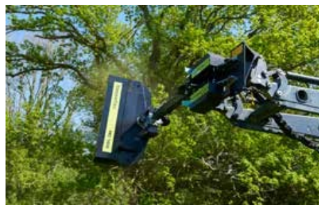
RC 162 késes sövényvágó fej