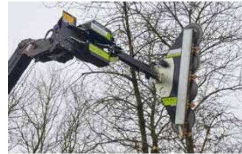
LRS 2402 tárcsás ágvágó fej