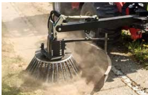
BR 70 fémszálas seprőfej