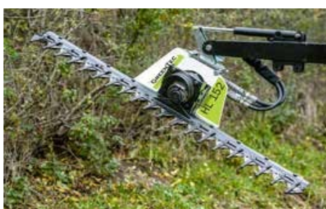
HL 152 - 212 alternáló ágvágó fej