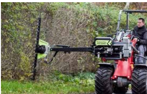
HL 152 alternáló ágvágó fej