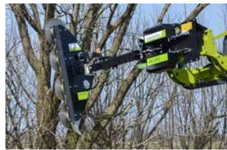
LRS 2002 tárcsás ágvágó fej