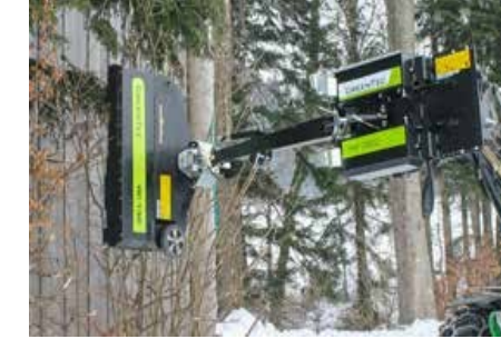
RC 132 késes sövényvágó fej

A gépeket magyar nyelvű kezelési és karbantartási utasítással, minőség tanúsítással adjuk át.