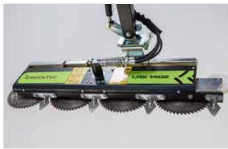
LRS 1402 tárcsás ágvágó fej