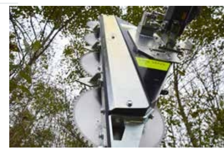
LRS 1602 tárcsás ágvágó fej