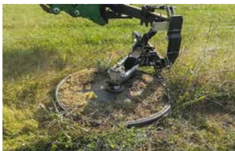
RI 60, RI 80 hidraulikus körkasza