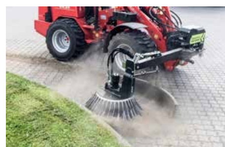
BR 70 fémszálal seprőfej (gyomkefe)