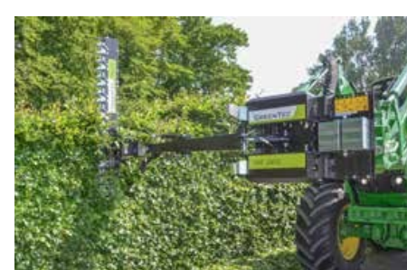
HS 172 alternáló ágvágó fej