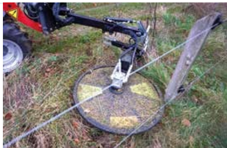
RI 60, RI 80 hidraulikus körkasza