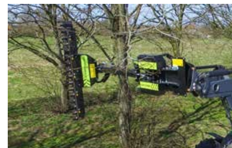
HX 170 - 270 alternáló ágvágó fej