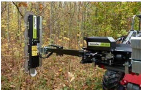
LRS 1402 tárcsás ágvágó fej