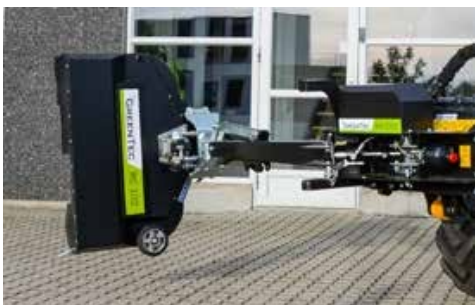
RC 102 késes sövényvágó fej