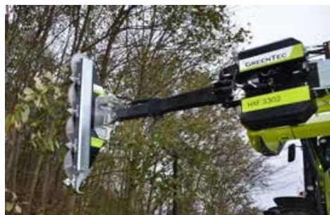
LRS 1602 tárcsás ágvágó fej