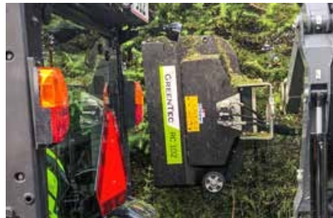
RC 102 késes sövényvágó fej