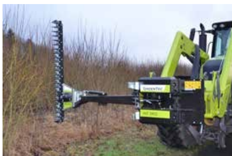
HL 182 és 212 alternáló ágvágó fej