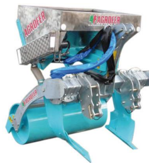
DAR C műtrágyaszórós talajlazító

A DAR talajlazítók robosztus, 120x120x8 mm acélvázal, II. kat. függesztéssel, 2 db ívelt lazítókéssel és egy 50 cm átmérőjű sima hengerrel készülnek. A késtartók állíthatók, a munkaszélesség változtatásához. A lazítókések nyírócsavaros biztosítással rendelkeznek, a művelési mélység hidraulikus munkahengerrel állítható.