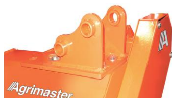
Fix csatlakozó a karhoz