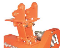
Automata szintezővel ellátott csatlakozó