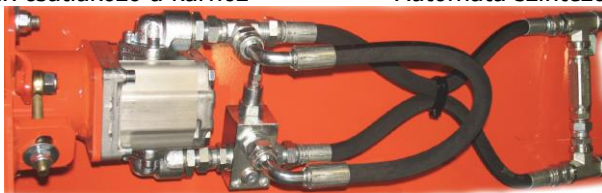
Anti-kavitációs kit 3/4" UT/UT Super