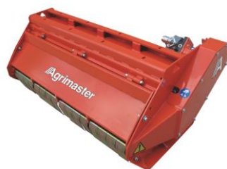
UT Super és UT F Super

A GL fejek az 1,5 – 2 t, a GL Super típusok a 2-3 t, az UT és UT F zúzófejek a 2,5-4 t, az UT Super és UT F Super szárzúzók a 3-6 t tömegű önjáró kotró-rakodó gépek (exkavátorok) karjára szerelve, a hordozó gép hidraulika rendszeréről működtethetők.