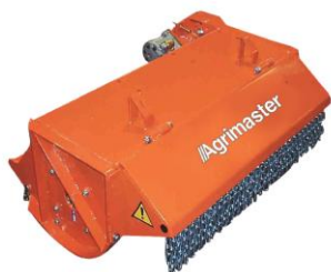
UT és UT F