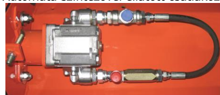
Anti-kavitációs kit 1/2" GL/GL Super