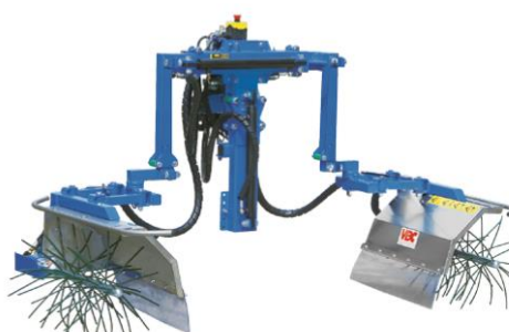
S1 (DX-SX) (15662122)

Hidas 2 fejes, 1 sorra, elektronikus JoyStick-os vezérléssel