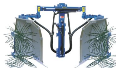
S2 (DX-SX) (15662124)

2 fejes, 2x félsorra, 3 karos vezérléssel