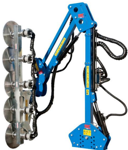
PJ 5 tárcsás síkfal metsző berendezés

Munkaszélesség: 230cm, Saját tömeg: 250-500kg; Max. munka magasság min. kinyúlásnál: 6m, Max. munka magasság max. kinyúlásnál: 4m, Autonóm hidraulika rendszer