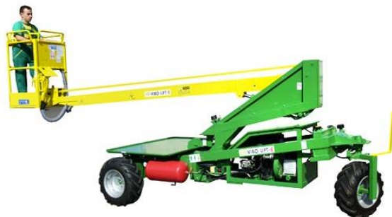
VIBO LIFT-E Hidraulikus kosaras metszőállvány (15520180001)

Gyümölcsültetvényekben, faiskolákban, kertészetekben metszéshez, védőfóliák és hálók felhelyezéséhez, szüreteléshez, valamint egyéb 7 m magasságig végzendő munkákhoz ajánljuk a hidraulikus kosaras metszőállványokat, melyek az elvégzendő munka függvényében harmadik kerék meghajtással is felszerelhetők.