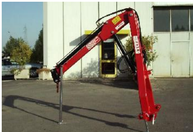
FAZA GPI-100 hidraulikus darukar

önsúly 330 kg; magasság 400 cm; max. teherbírás 990 kg