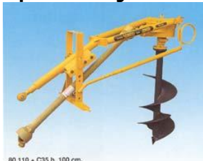
80.110 + C35 h. 100 cm.

Az erőgép középvonalaiban dolgozó, egy irányú hajtóművel szerelt gépek opciói: