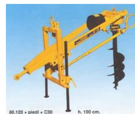
80.120 + pletil + C30 h. 100 cm.

Forgócsap oldalállításhoz I. T70 (cikkszám 13100570) a T02 típusokhoz, II. T71 (cikkszám 13100571) a T03 és T06 típusokhoz cikkszám 13100502