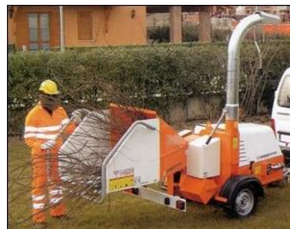
C150 MTS sajátmotoros vontatott nyesedékaprító

A TPS függesztett és a TTS vontatott gépek az erőgép TLT-jéről kardánnal kapják a meghajtást. Az MTS vontatott, saját motorral hajtott kivitel, melyhez opcióként rendelhető a közúti közlekedésre is alkalmas -max. 80 km/h - rugózott futómű.