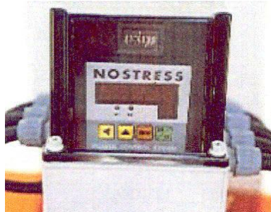
NOSTRESS + üzemóra számláló