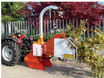
C150 TPS függesztett nyesedékaprító

A CHIPPER nyesedékaprító gépeket az ültetvényekben, parkokban, közterületeken keletkezett fás nyesedékek aprítására ajánljuk. Használatukkal a metszésből, fakivágásból keletkező nagy tömegű lomb és ág jóval gazdaságosabban szállítható el, illetve könnyebb a további kezelése, feldolgozása.