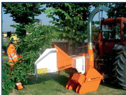
C170 TPS függesztett nyesedékaprító