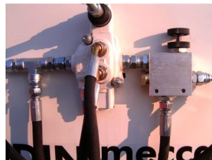
Behúzó henger szabályzó szelep