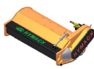
TR rotor TL hajtással