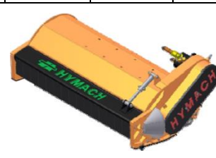
TR rotor TL hajtással