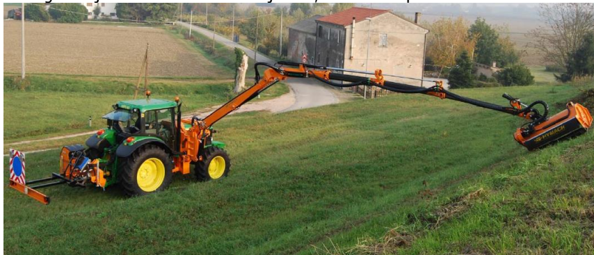
EXTREME TDH G1000 TC szárzúzó széria

A HYMACH EXTREME nehéz kategóriás (G) centrális függesztésű (TC) rézsúkasza sorozat, közparkok, útmenti területek és árok rézsúk, töltésoldalak vegetációjának karbantartására ajánlott, elsősorban professzionális felhasználók részére.