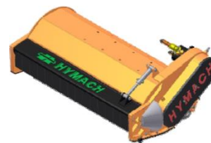
TR rotor TL hajtással