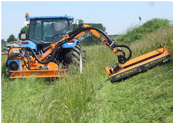
RHINO C400 TR szárzúzó széria

Min.trakt. tömeg 4000-4300kg, telj. 110LE, tömeg 1230-1300kg, kar 2 tagos, 0-1 teleszkópos, oldal kinyúlás 400-490cm, vágás szél. 200cm, száll. magasság 280-330cm