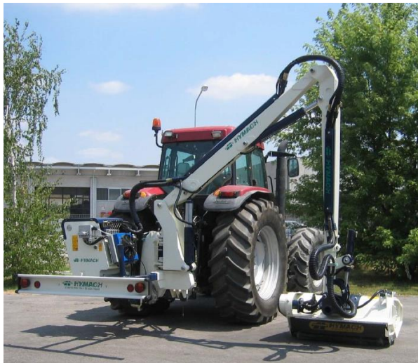
LIBRA SP600 TR szárzúzó széria

Min.trakt. tömeg 4500-5500kg, telj. 100-120LE, tömeg 1600-1780kg, kar 2 tagos, 1-2 teleszkópos, oldal kinyúlás 630-905cm, vágás szél. 125cm, száll. magasság 350-365cm