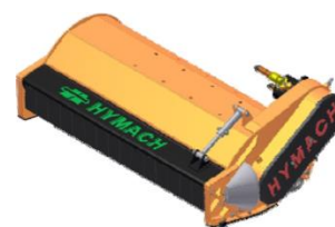
TR rotor TL hajtással