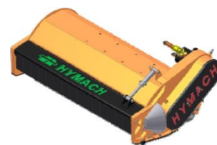
TR rotor TL hajtással