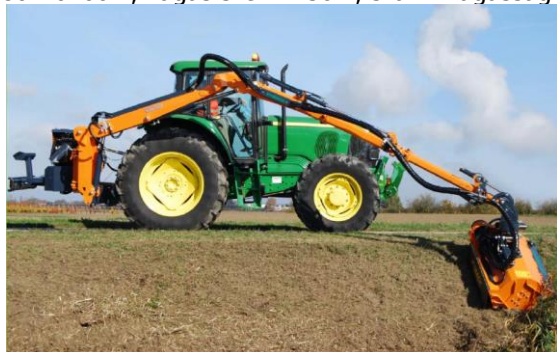
VERYVIS VAP600 TR szárzúzó széria

Min.trakt. tömeg 4500-6000kg, telj. 110-130LE, tömeg 2050-2250kg, kar 2 tagos, 1-2 teleszkópos, oldal kinyúlás 680-1020cm, vágás szél. 125cm, száll. magasság 360-395cm