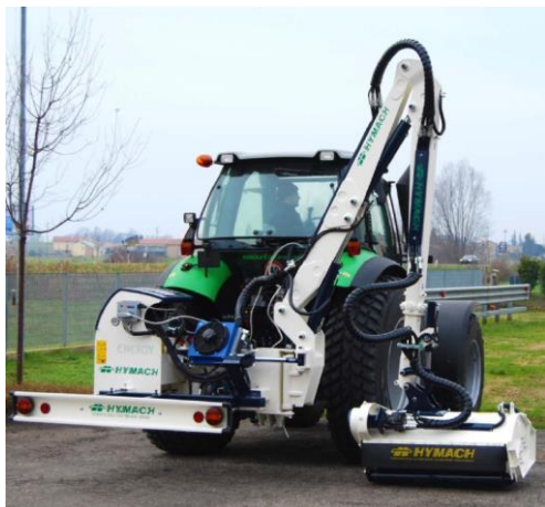
ENERGY P600 TR szárzúzó széria

Min.trakt. tömeg 4500-5500kg, telj. 100-120LE, tömeg 1550-1850kg, kar 2 tagos, 1-2 teleszkópos, oldal kinyúlás 603-990cm, vágás szél. 125cm, száll. magasság 355-395cm