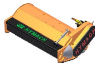
TR rotor TL hajtással