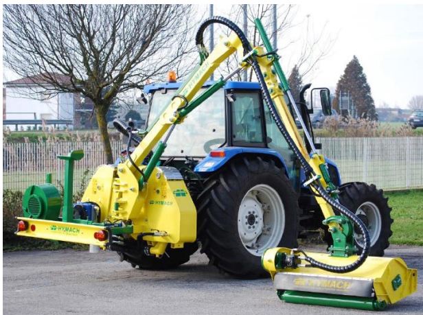
DOUBLE TRUSTY TDH M550 TR DS szárzúzó széria

Jobb és baloldali munkavégzés! Min.trakt. tömeg 2500kg, telj. 70LE, tömeg 1350kg, kar 2 tagos, 1 teleszkópos, oldal kinyúlás 560cm, vágás szél. 125cm, száll. magasság 374cm