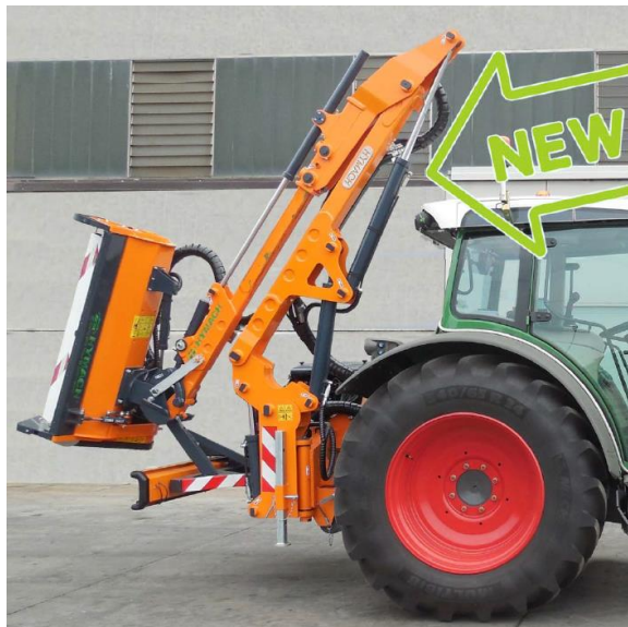
TRUSTY FLEXOR TPH M600 TR szárzúzó széria

Min.trakt. tömeg 3100-4000kg, telj. 70LE, tömeg 1185-1225kg, kar 2 tagos, 1 teleszkópos, oldal kinyúlás 603-668cm, vágás szél. 125cm, száll. magasság 348cm