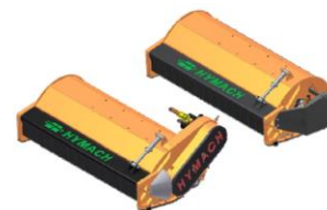
TSL rotor TL és TD hajtással