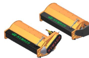
TSL rotor TL és TD hajtással