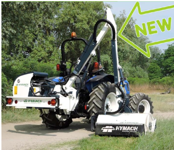
JOLLY TDH L500 TR szárzúzó széria

Min.trakt. tömeg 2300-2500kg, telj. 60LE, tömeg 790-870kg, kar 2 tagos, oldal kinyúlás 460-565cm, vágás szél. 105cm, száll. magasság 305-364cm