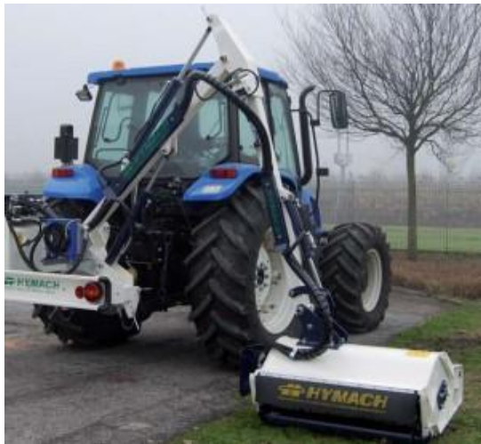
POCKET JOLLY TDH L450 TR szárzúzó széria

Min.trakt. tömeg 2300kg, telj. 60LE, tömeg 800kg, kar 2 tagos, oldal kinyúlás 420cm, vágás szél. 105cm, száll.mag.2,9m