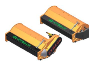
TSL rotor TL és TD hajtással