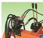
2 karos távvezérlő (08020836)