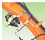
Hidro-pneumatikus akkumulátor (08020835)

A zúzófej használható az erőgép középvonalában, hidraulikusan kihelyezhető a jobb oldalra, opcionálisan a baloldalra, valamint beállítható a vízszintestől eltérő szögben a vágandó felülethez igazodva. Csak a talaj felett dolgozhat!