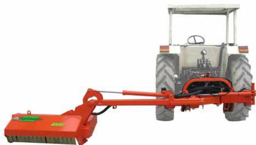
ELP 125 P hátsó függesztésű padkakasza

telj. igény 40-45 LE; min. tr. tömeg 2500-2800 kg; vágható max. átm. 1-2 cm; oldal kinyúlás 385-389 cm; munka szél. 126-150 cm; rézsű +90°/-60°; saját tömeg 590-625 kg; front és hátsó függ.