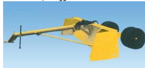
LT vontatott széria

Alapfelszereltség: -I-II.vagy II. kategóriás 3p. függesztés - Támasztó láb - Oldallemez készlet