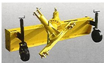
Az 55 széria tagjai opcióként kiegészíthetők állítható vezető kerekekkel (cikkszám: 04200503)