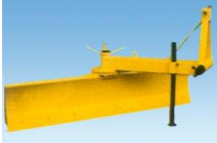
A 45.1 és 55.1 szériáknál a lap 360°-ban állítható

A robosztus felépítése és pontos beállíthatósága biztosítja a széleskörű felhasználhatóságukat és a hosszú élettartamukat. A jó minőségű tereprendezők akár 15LE szükséglet mellett.