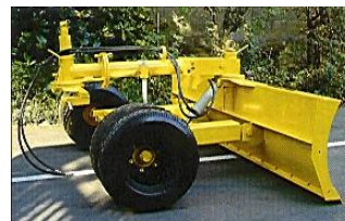
A 75.4 EXTRA széria opcióként kiegészíthető hidraulikusan állítható kocsival (cikkszám: 042000501)