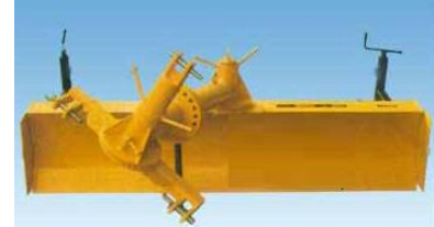
Az 55.3 széria lapja függőlegesen és vízszintesen 360°, a függesztés vízszintesen 180°-ban állítható.