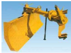
A 75.4 EXTRA széria lapja dönthető 16°-ban, függőleges síkban állítható 360°-ban. Függesztése forgatható 180°-ban.