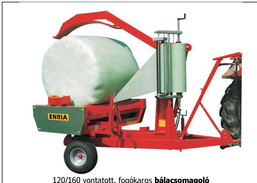
120/160 vontatott, fogókaros bálacsomagoló

telj.igény 40-50 LE; bála átmérő 90-120 és 120-160 cm; fólia szélesség 50-75 cm; vastagság 25-30 µm; tömeg 580-940 kg