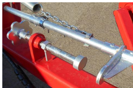
A csillagkerékek finom beállítója