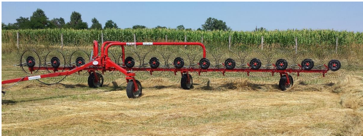
FAZA RTR/13-4R vontatott csillagkerékű rendszáró (cikkszám: 03000071040)

Teljesítményigény 100-120 LE, munkaszélesség 760 cm, tömeg 1250-1370 kg