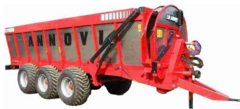
RS-200 típusú szervestrágya-szóró