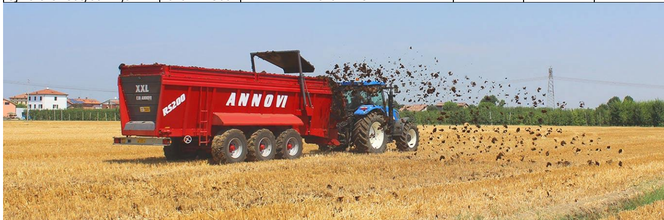
ANNOVI RS200 turbinás oldalt szóró