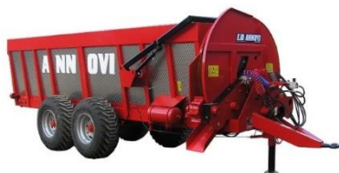
RS-180 típusú szervestrágya-szóró