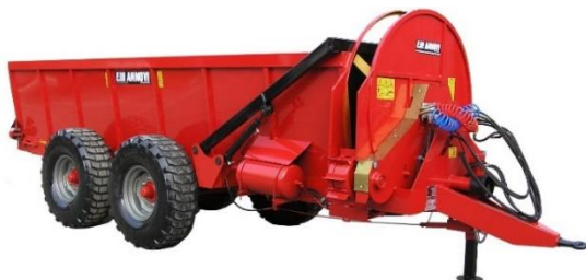
B-150 típusú szervestrágya-szóró

Beállítástól és anyagminőségtől függően 1 t trágya 1-5 perc alatt szórható ki.