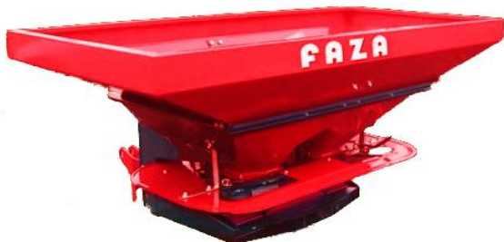
1000 literes FAZA DE LUX műtrágyaszóró

tartály 1000-2000 l; szórásszél. 12-24 m; tartály szél. 230-240 cm; hossz. 127-157 cm; min. töltési magasság 110-145 cm; önsúly 300-400 kg; 3 pont függ. II-III. kat; TLT 540; meghajtó teljesítményigény 12 LE