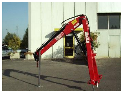
FAZA GPI-100 hidraulikus darukar